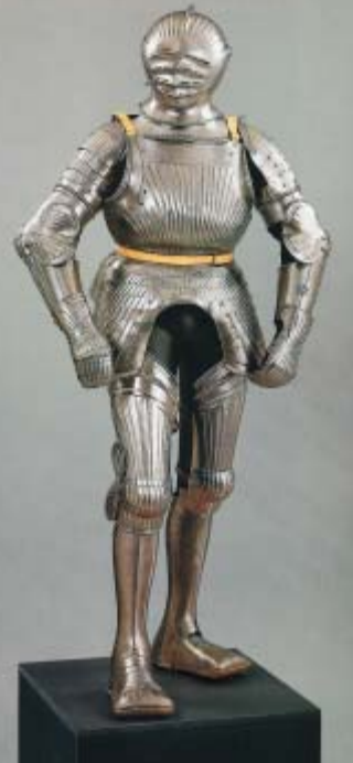
Rüstung, maximilianisch, ca. 1520.

Bei dem Kaufverhalten geht der Trend zunehmend weg davon, innerhalb eines Jahres viele Objekte zu kaufen, hin zum ge-