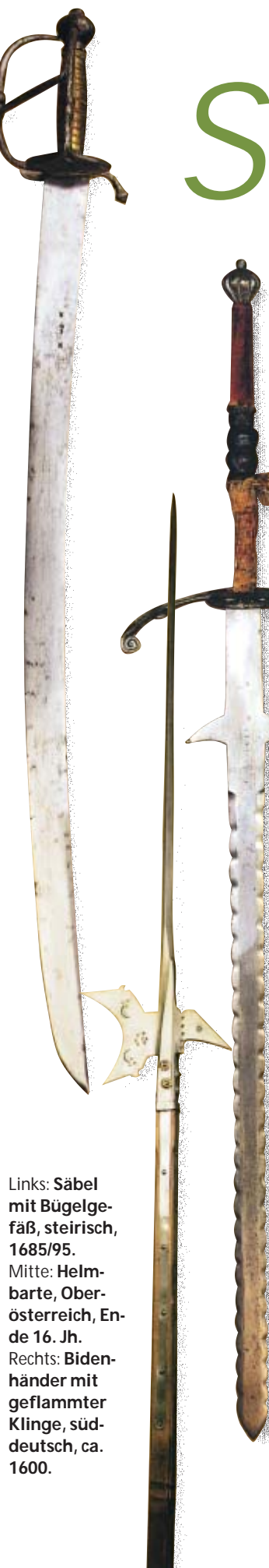
Links: Säbel mit Bügelgefaß, steirisch, 1685/95. Mitte: Helmbarte, Oberösterreich, Ende 16. Jh. Rechts: Bidenhänder mit geflammter Klinge, süddeutsch, ca. 1600.

Im Gegensatz zum großen Angebot ziviler Schusswaffen steht der großen Nachfrage nach militärischen Pistolen und Gewehren deutscher Staaten des 18. und 19. Jahrhunderts nur ein geringes Angebot gegenüber. Dies führte in den letzten Jahren zu steilen Preisanstiegen. Erneut bestätigte sich zudem, dass Sammler