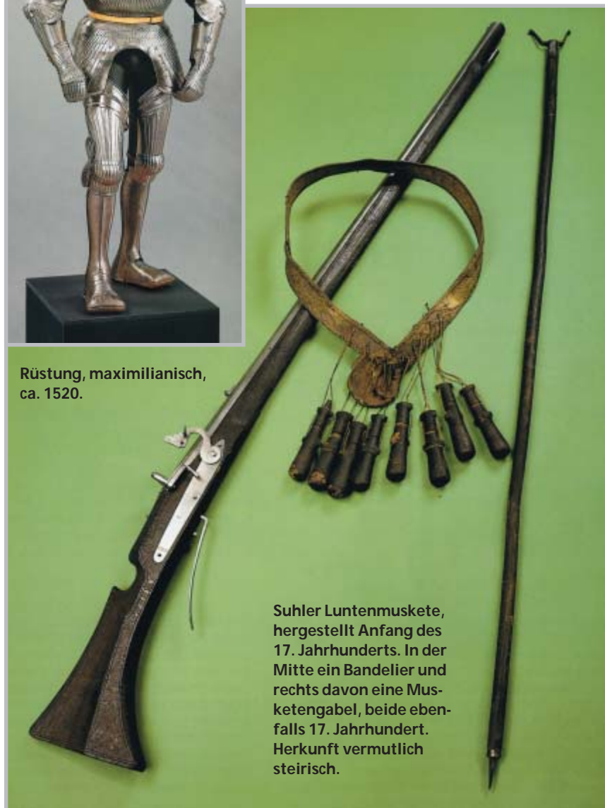
Suhler Luntenmuskete, hergestellt Anfang des 17. Jahrhunderts. In der Mitte ein Banielier und rechts davon eine Musketengabel, beide ebenfalls 17. Jahrhundert. Herkunft vermutlich steirisch.

zielten zwei- bis dreimaligen Kauf im Jahr. Immer mehr spielt dabei auch der spätere Wiederverkauf eine Rolle, wohingegen in früheren Jahren das optische Erscheinungsbild einer Waffe oftmals unabhängig von deren Qualität beim Kauf ausschlaggebend war.